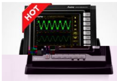
WP4000 变频功率分析仪_全局精度功率分析仪