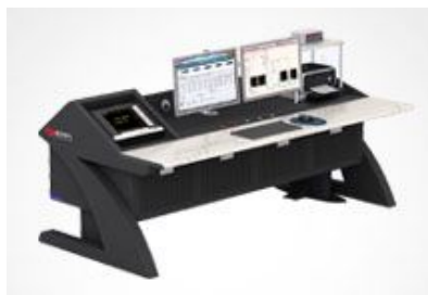
助力电机能效提升计划，加速电机产业转型升级

前端数字化 复杂电磁环境下的高精度测量解决方案 不同功率因数下相位误差对功率测量准确度的影响 幅值对测量准确度的影响？ 准平均值真的可以替代基波有效值吗？