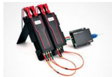
5- 400Hz 范围内实现 0.2% 的全局精度的 低成本